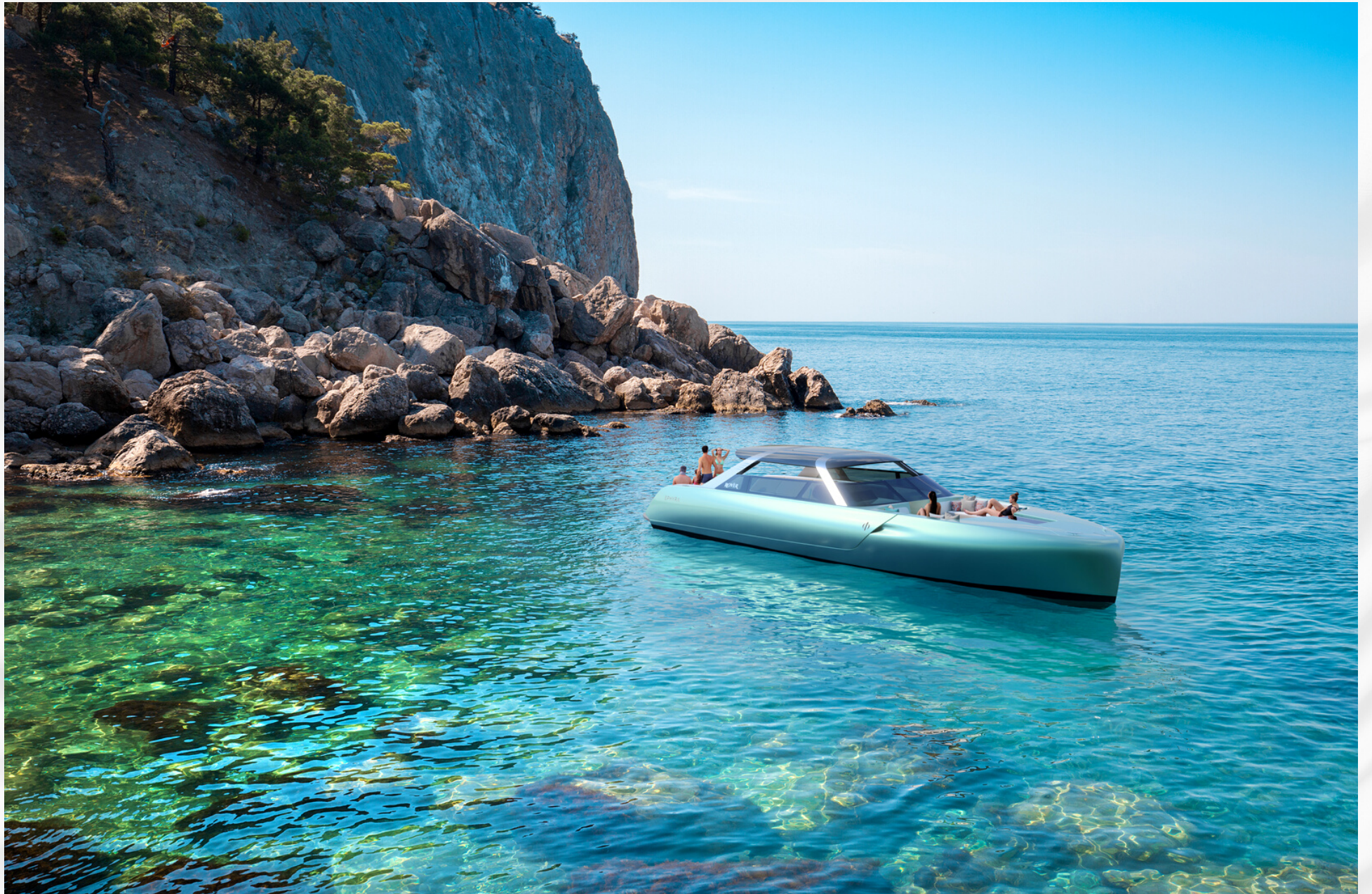
TYPE 48 ROVER