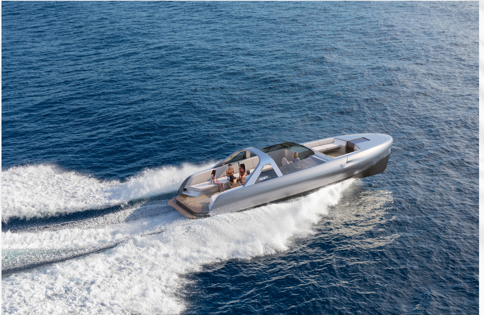
TYPE 48 OPEN