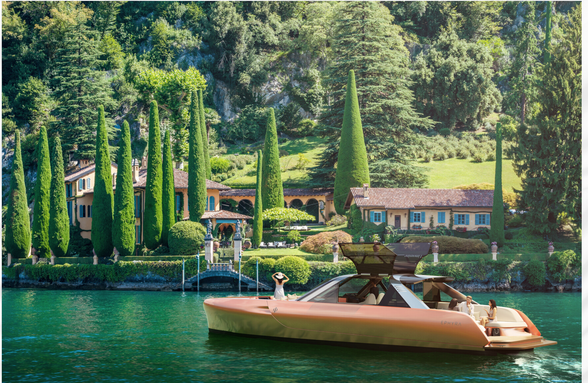
TYPE 48 LIMOUSINE